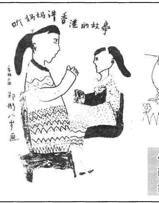
听妈妈讲香港的故事

梦游香港 新款式的轿车飞驰而过，大小车辆穿流不息。“啪”迷迷糊糊有人给我关了台灯。